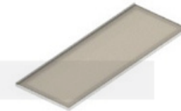
PORTA ALTA COM PERFIL DE ALUMÍNIO NATURAL E VIDRO COM PELÍCULA

119,2X44,1X1,8 PORTA - 393908 Somente para Armário Roupeiro (393556)