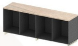
ARMÁRIO BAIXO - PROF. 60cm