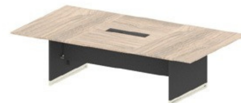
MESA REUNIÃO - 329,8cm

ESTRUTURA - 393411 - 224,9X79,8X71,5 TAMPO LATERAL - 393915 - 120X74,9X2,5 TAMPO CENTRAL - 393917 - 150X120X2,5 PÉ PAINEL - 393914 - 72,5X79,8X2,5