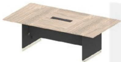
MESA REUNIÃO - 224,7cm

Lista de información: código + anch. x prof. x alt.