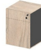
GAVETEIRO MONTADO 1 GAVETA 1 GAVETÃO COM TRAVAMENTO SIMULTÂNEO

43,6X44X58,9 ESTRUTURA + GAVETA - 393902