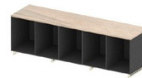
ARMÁRIO BAIXO - LARG. 228cm