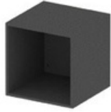
NICHO - 43,8 CM