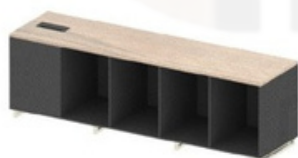
ARMÁRIO PARA APOIO DE MESA DINÂMICA - LARG 228 CM