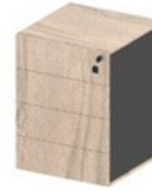
GAVETEIRO MONTADO 4 GAVETAS COM TRAVAMENTO SIMULTÂNEO

43,6X44X58,9 ESTRUTURA + GAVETA - 393902