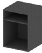
NICHO BIPARTIDO COM PRATEIRA - 58,9 CM