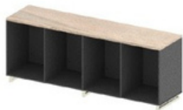
ARMÁRIO BAIXO - PROF. 46,5cm

*Caixa de tomada não inclusa, solicitar a parte.