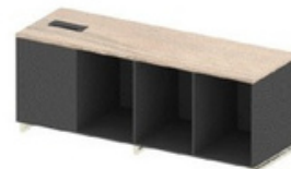
ARMÁRIO PARA APOIO DE MESA DINÂMICA - LARG 182 CM