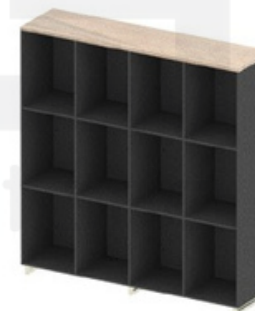
ARMÁRIO ALTO - LARG. 182,7CM