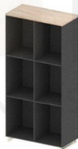
ARMÁRIO ALTO - LARG. 92,2cm