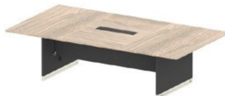
MESA REUNIÃO - 299,8cm

ESTRUTURA - 393410 - 149,8X79,8X71,5 TAMPO LATERAL - 393915 - 120X74,9X2,5 TAMPO CENTRAL - 393916 - 74,9X120X2,5 PÉ PAINEL - 393914 - 72,5X79,8X2,5